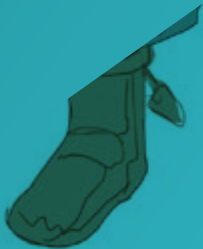
Ilustración y Diseño Multimedia