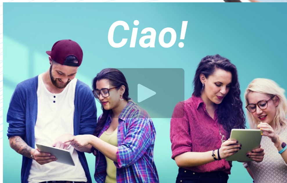
Video di presentazione

L'Italia è la terra di Michelangelo, Raffaello e Leonardo, ma è anche la terra della Ferrari e delle grandi marche di moda. È un Paese che combina storia, cultura, industria e glamour, e ha un grande peso nel panorama europeo, rendendolo una regione molto attraente in molti settori. Per poter accedere a processi lavorativi o accademici in Italia, è necessario dimostrare una grande padronanza della lingua, ed è per questo che TECH offre agli studenti la possibilità di sostenere e superare questo test di livello C1. Questa certificazione universitaria è conforme al Quadro Comune Europeo di Riferimento per la Conoscenza delle Lingue, il sistema di riconoscimento linguistico più rispettato e valido a livello internazionale.