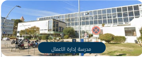
مدرسة إدارة الأعمال

يمكنك للطلاب أن يفهم هذا التدريب في المراكز التالية: