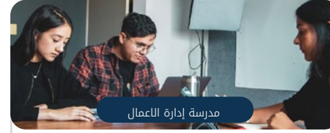
مدرسة إدارة الأعمال