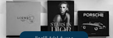
مدرسة إدارة الأعمال

التدريبات العملية ذات الصلة: إدارة الاتصال والسمعة الرقمية - النمذجة العضوية ثلاثية الأبعاد