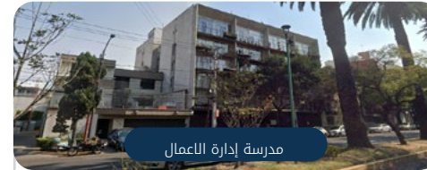
مدرسة إدارة الأعمال

التدريبات العملية ذات الصلة: الدعاية الإعلانية - MBA التسويق الرقمي