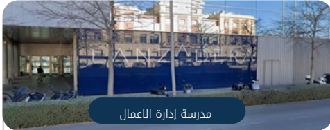
مدرسة إدارة الأعمال

التدريبات العملية ذات الصلة: - إدارة التواصل في الموضة والرفاهية - إدارة شركات الاتصالات