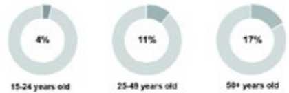
Freelancers in the UK as a percentage of the total workforce