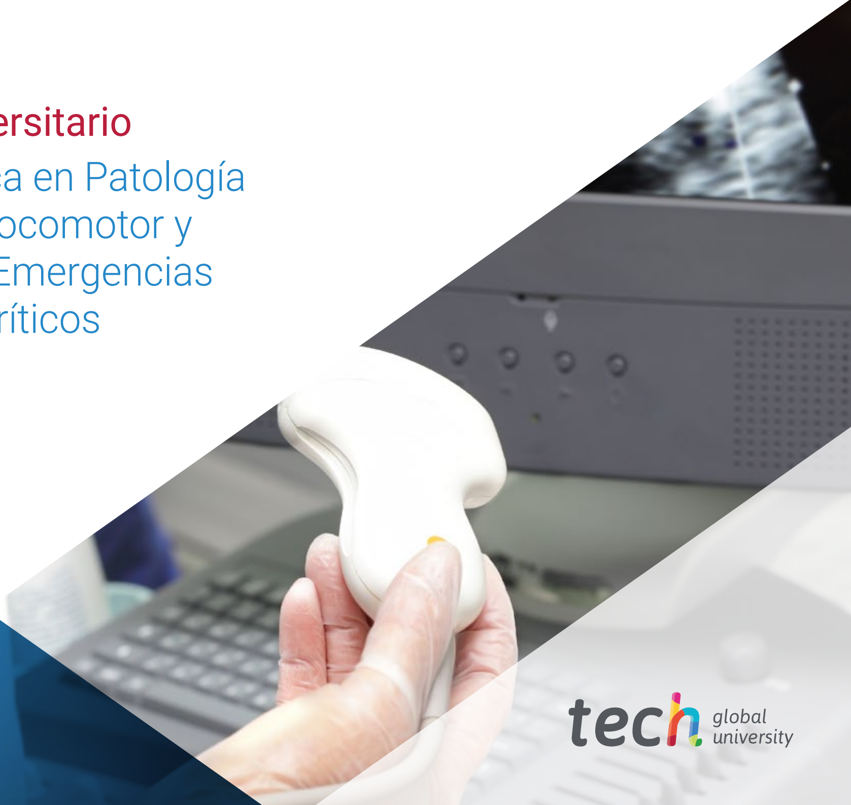
Imagen Clínica en Patología del Aparato Locomotor y Digestivo en Emergencias y Cuidados Críticos