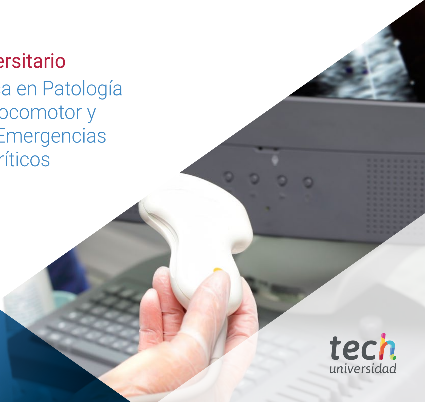
Imagen Clínica en Patología del Aparato Locomotor y Digestivo en Emergencias y Cuidados Críticos