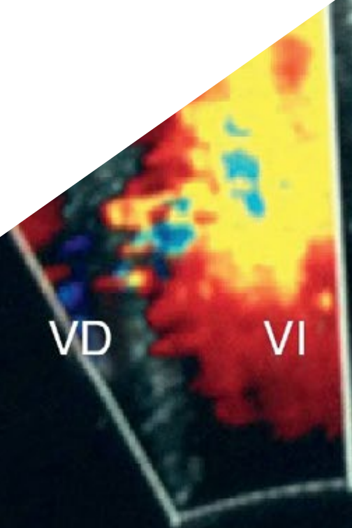
Imagen Cardíaca no Invasiva y Pruebas Funcionales en Cardiología Pediátrica