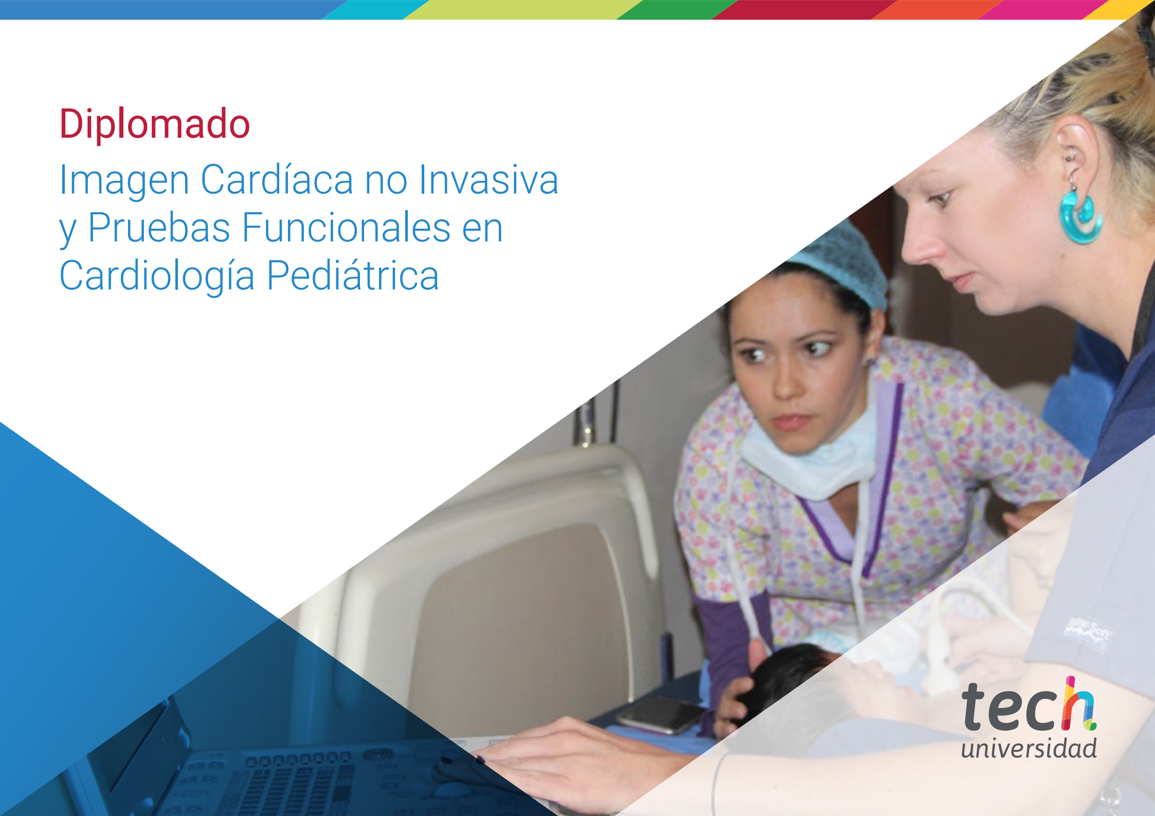
Imagen Cardíaca no Invasiva y Pruebas Funcionales en Cardiología Pediátrica