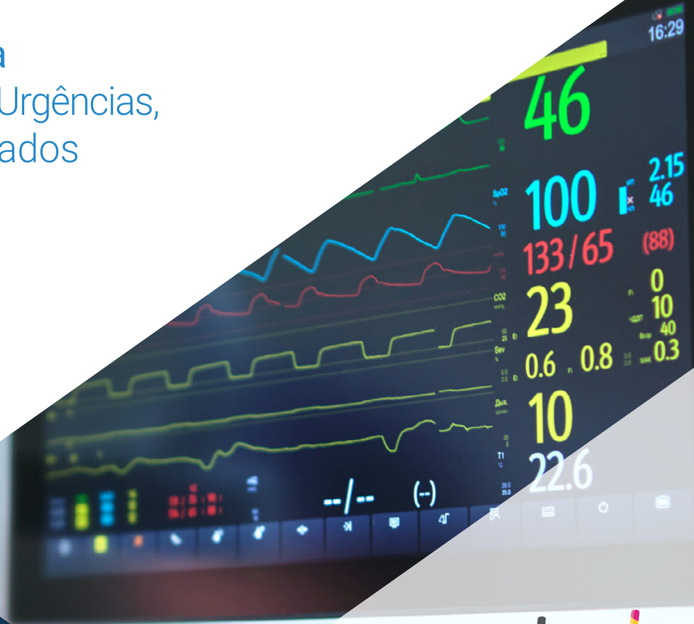
Imagem Clínica para Urgências, Emergências e Cuidados Intensivos