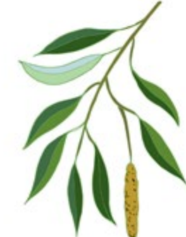
WHITE WILLOW BARK