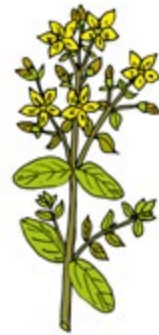
ST. JOHN'S WORT