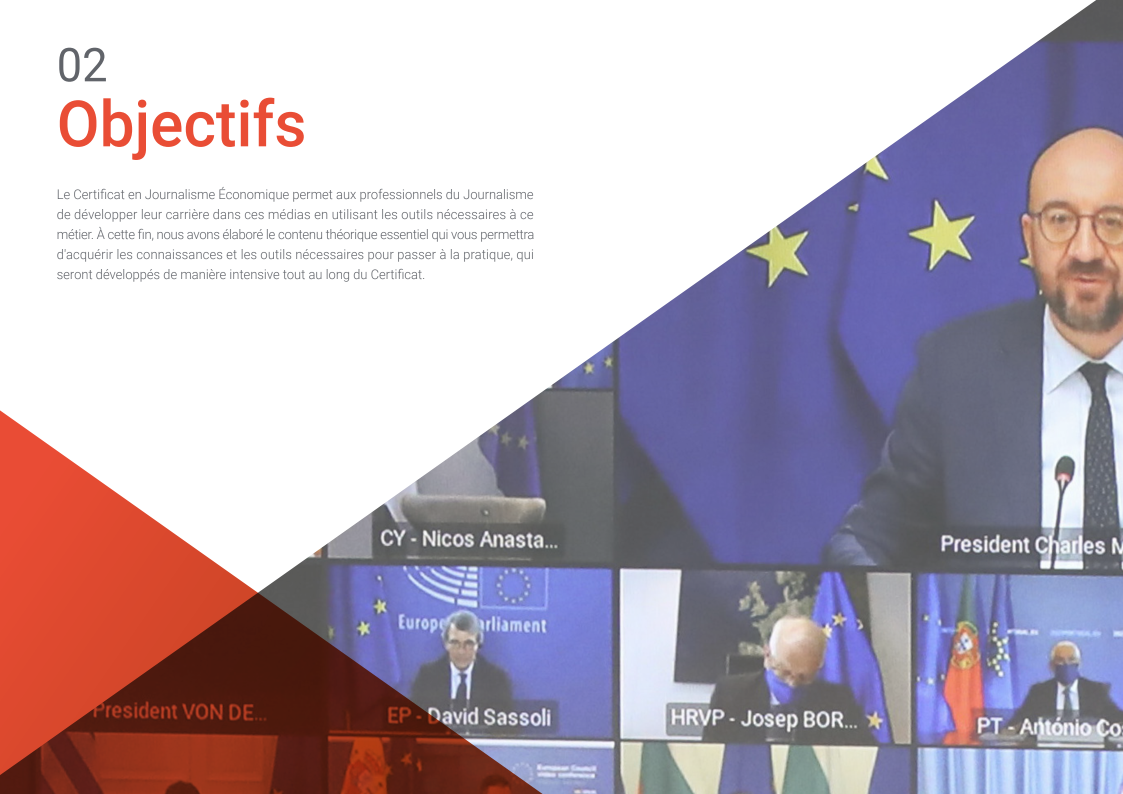
CY - Nicos Anasta...

Le Certificat en Journalisme Économique permet aux professionnels du Journalisme de développer leur carrière dans ces médias en utilisant les outils nécessaires à ce métier. À cette fin, nous avons élaboré le contenu théorique essentiel qui vous permettra d'acquérir les connaissances et les outils nécessaires pour passer à la pratique, qui seront développés de manière intensive tout au long du Certificat.