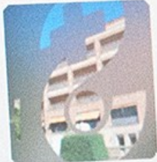
Transparencia y buen gobierno