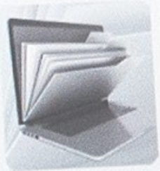
Trámites y prestaciones

ública generando total transparencia a la hora de explicar la gestión ianza entre los ciudadanos.