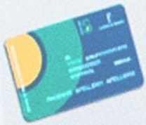
Cambios tarjeta sanitaria