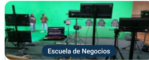
Escuela de Negocios