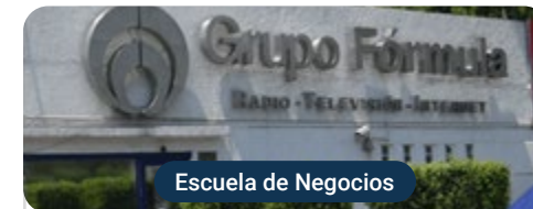
Escuela de Negocios