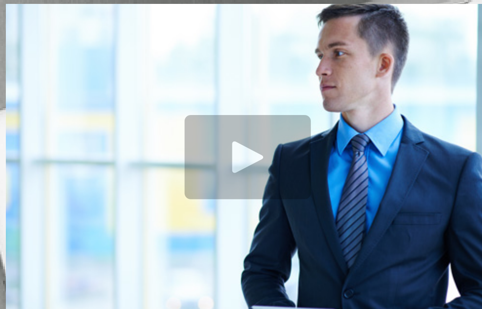
Experto Universitario en Análisis Exploratorio y Procesamiento de Datos de Negocio TECH Universidad FUNDEPOS

La sociedad se mueve en un mundo de datos complejos y la mejor forma de entenderlos es a través de representaciones gráficas. Esto hace imprescindible para las empresas seleccionar perfiles analíticos. Así, mediante el uso de lenguajes de programación, se afrontarán las tareas esenciales en la analítica de datos y se indagará en el resumen de la información con las estadísticas y gráficas que recojan las conclusiones. Esta titulación ofrecerá al empresario un conjunto exclusivo de Masterclasses que actuarán como herramienta fundamental para allanar su camino hacia el liderazgo empresarial. Estas lecciones han sido diseñadas por un reconocido experto internacional, especialista en Business Intelligence . Al finalizar el programa, el egresado estará preparado para brillar en cualquier contexto profesional que se le presente.