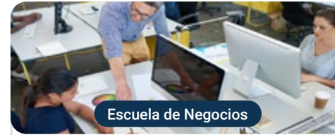
Escuela de Negocios