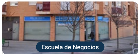
Escuela de Negocios