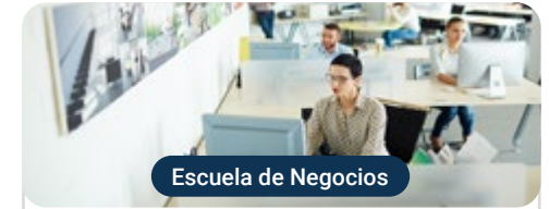
Escuela de Negocios

Capacitaciones prácticas relacionadas: -Creación y Emprendimiento en la Empresa Digital -MBA en Marketing Digital