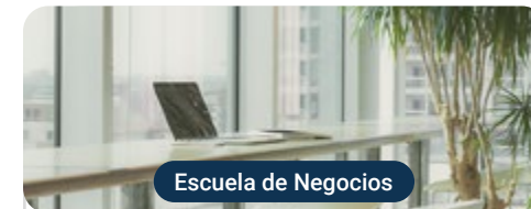
Escuela de Negocios