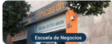
Escuela de Negocios