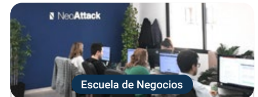
Escuela de Negocios