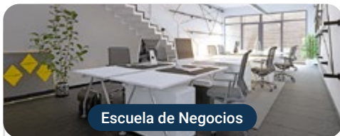
Escuela de Negocios

Capacitaciones prácticas relacionadas: -MBA en Marketing Digital -Diseño Gráfico