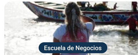
Escuela de Negocios