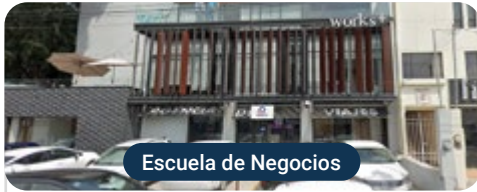
Escuela de Negocios