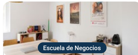
Escuela de Negocios