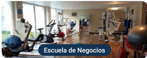
Escuela de Negocios