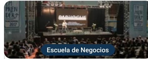
Escuela de Negocios