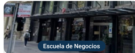
Escuela de Negocios

Capacitaciones prácticas relacionadas: -MBA en Dirección Comercial y Ventas -MBA en Dirección de Compras