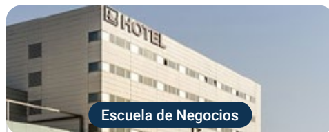
Escuela de Negocios