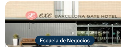
Escuela de Negocios