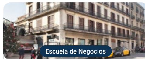
Escuela de Negocios