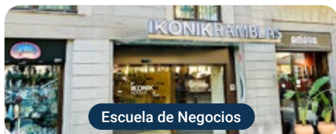
Escuela de Negocios