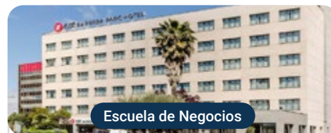
Escuela de Negocios