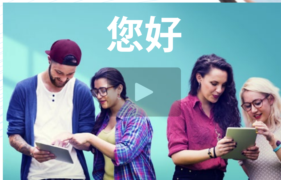
Vídeo de presentación

Los programas de idiomas de TECH cuentan con el respaldo del más importante sistema de reconocimiento de idiomas: el Marco Común Europeo de Referencia para las Lenguas. Así, este examen universitario conduce a la obtención de un certificado de Nivel C2 de Chino acorde a los estándares del MCER, por lo que el estudiante que haya superado la prueba podrá participar en numerosos procesos profesionales y académicos que requieran de un dominio absoluto de este idioma.