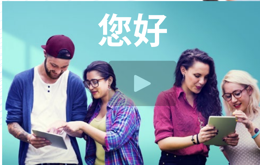
Vídeo de presentación

El chino ha venido consolidándose en los últimos años como un idioma vehicular a la hora de cerrar negocios internacionales. Esta realidad lleva a muchísimos profesionales a querer certificar su nivel en esta lengua, pues solo así conseguirán escalar a esas oportunidades profesionales. Este Examen de Nivel de TECH provee al estudiante de una certificación oficial según los requerimientos del Marco Común Europeo de Referencia para las Lenguas. Todo ello, tras la realización de un test 100% online, flexible y cómodo que les ayudará a llegar a lo más alto y a diferenciar su perfil profesional frente a la competencia.