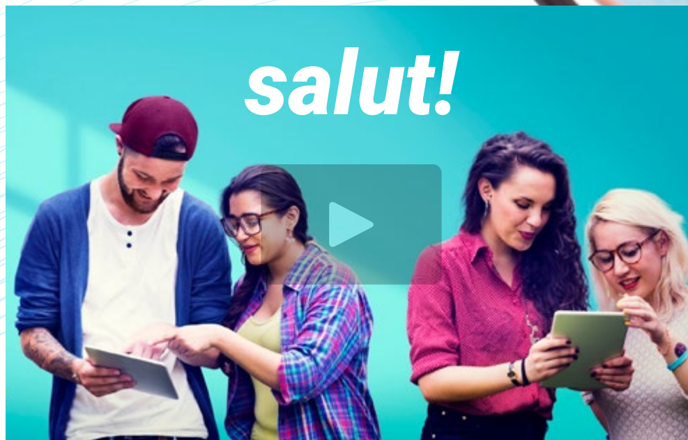
Vídeo de presentación

Por ello, un aval como el que proporciona este Examen de Idiomas A1 MCER de Francés supone un buen impulso para todo currículum vitae. Al estar basado en el Marco Común Europeo de Referencia para las Lenguas tiene una validez global y permanente. Siendo el nivel más accesible, es el que menos dificultades impone para validar un conocimiento básico del idioma.