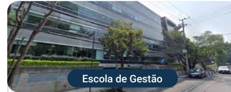
Escola de Gestão