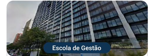
Escola de Gestão