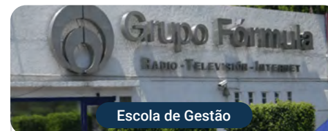
Escola de Gestão