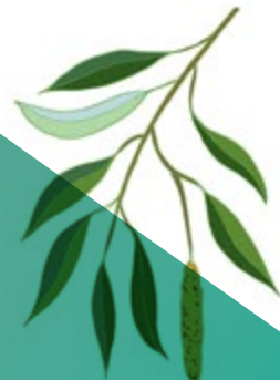
WHITE WILLOW BARK