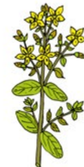
ST. JOHN'S WORT