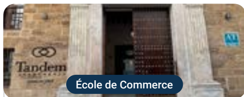
École de Commerce