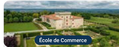
École de Commerce