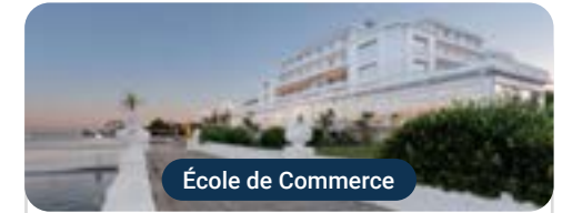
École de Commerce