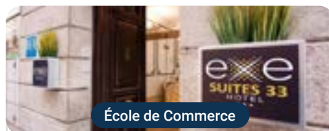
École de Commerce