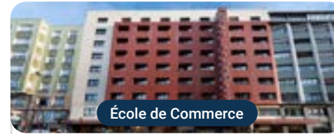
École de Commerce