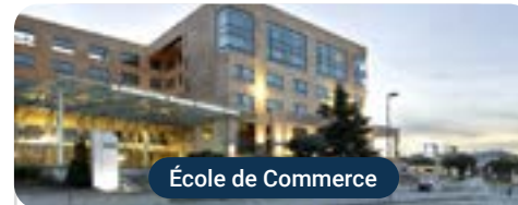
École de Commerce