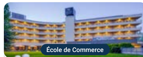
École de Commerce