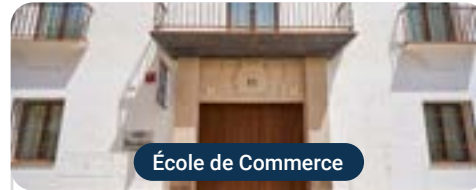
École de Commerce