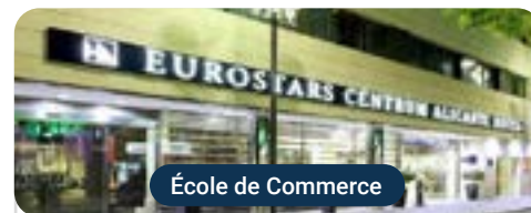
École de Commerce