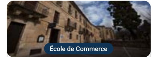
École de Commerce