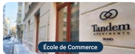
École de Commerce