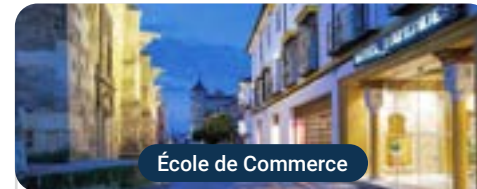
École de Commerce