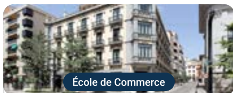
École de Commerce