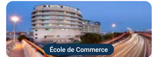
École de Commerce