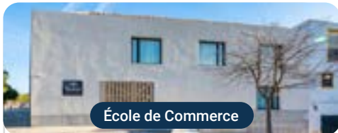
École de Commerce