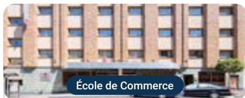
École de Commerce