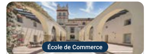
École de Commerce