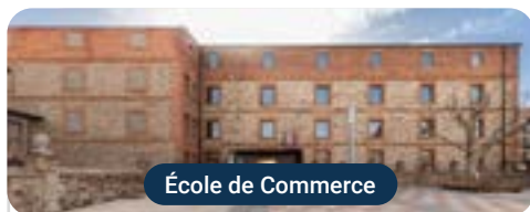
École de Commerce