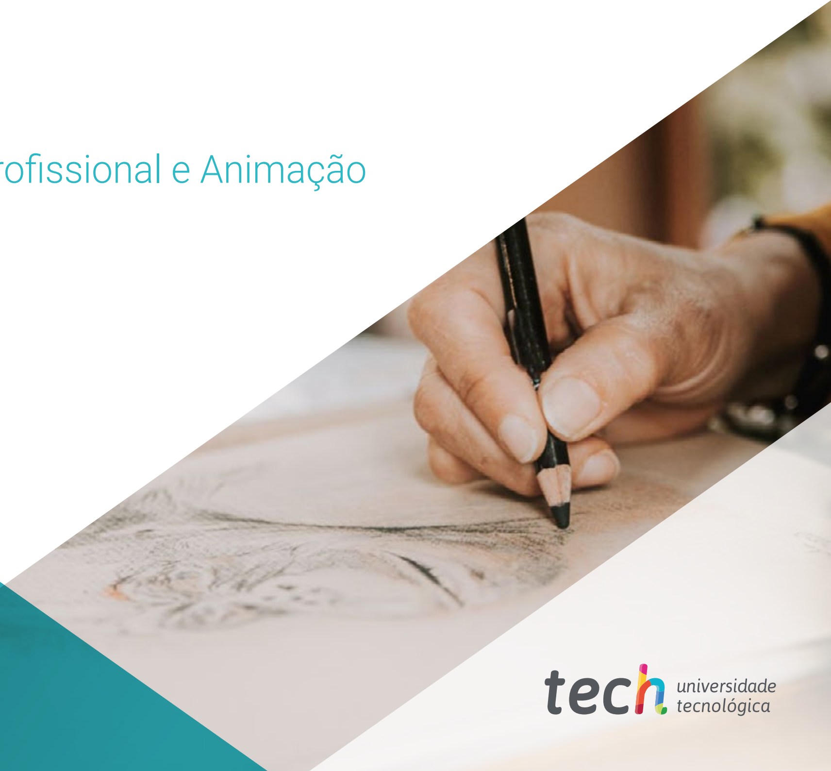
Ilustração Profissional e Animação