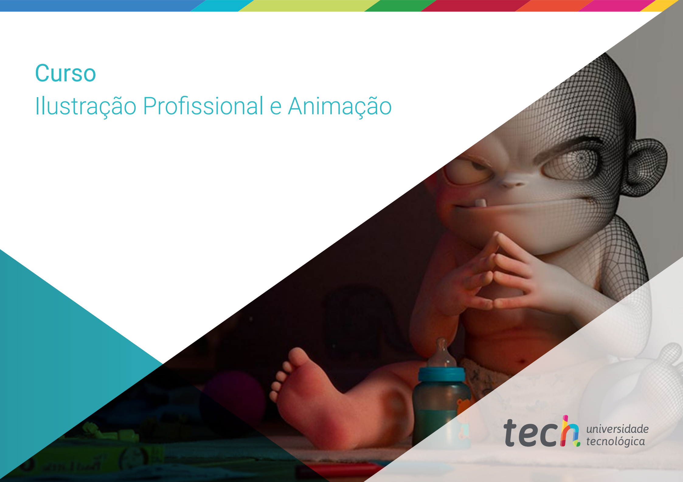
Ilustração Profissional e Animação