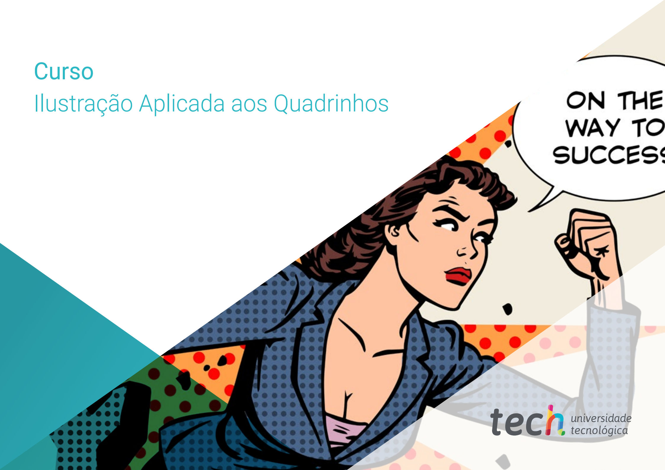
Ilustração Aplicada aos Quadrinhos