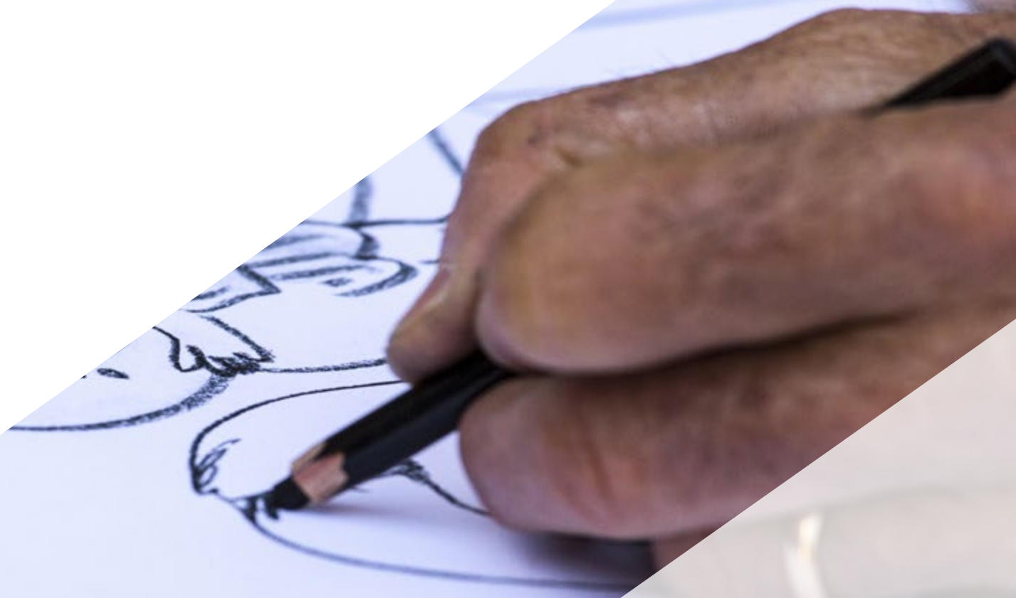
Ilustração Aplicada aos Quadrinhos