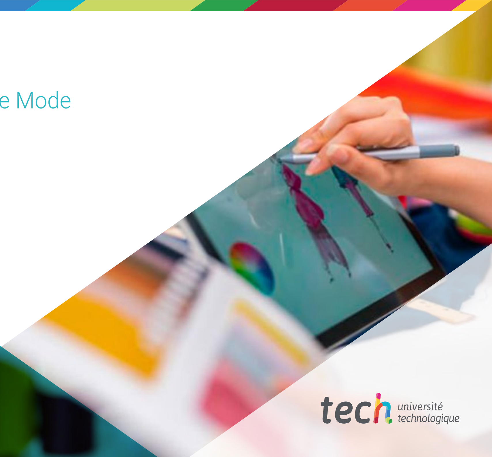
Illustration de Mode