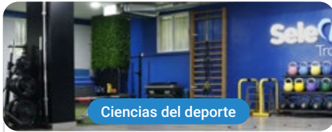
Ciencias del deporte