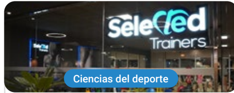
Ciencias del deporte

Capacitaciones prácticas relacionadas: -Alto Rendimiento Deportivo -Entrenamiento Personal Terapéutico