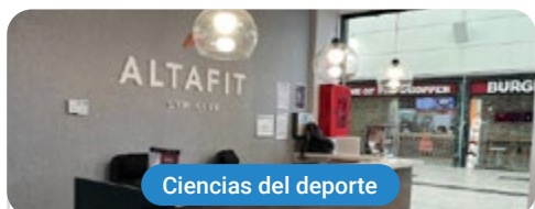
Ciencias del deporte

Capacitaciones prácticas relacionadas: -Monitor de Gimnasio