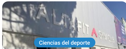
Ciencias del deporte

Capacitaciones prácticas relacionadas: -Monitor de Gimnasio