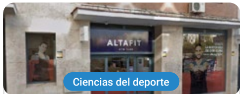
Ciencias del deporte