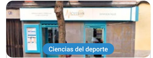
Ciencias del deporte